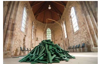
Photos et graphiques: © Elke Birkelbach/Peter Lupp, réserve de biosphère du Bliesgau

La Réserve de biosphère UNESCO du Bliesgau appelle donc toutes les réserves de biosphère du monde à y contribuer aussi par une touche artistique, de préférence sous forme d'une citation poétique sur les spécificités régionales liées au thème de la transformation, d'ici fin juillet 2021. Ainsi, l'effet de l'art et de la poésie au sein de la communauté mondiale des réserves de biosphère de l'UNESCO sera d'autant mieux mis en valeur et décuplé. La totalité des contributions seront publiées sur le site Web de la réserve de biosphère du Bliesgau ( www.biosphaere-bliesgau.eu/weltenkreis ) et présentées sur place avec l'œuvre d'art émergente «Cercle mondial- Terre».