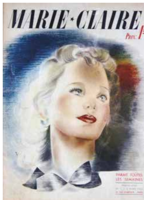
Exemples de « n°1 » de la Collection de M. Alain Schott