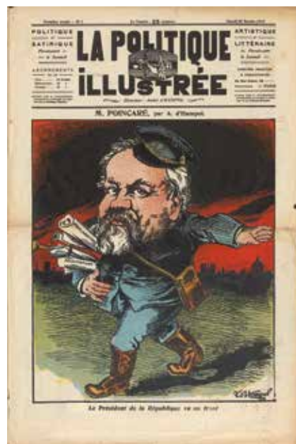
Exemples de « n°1 » de la Collection de M. Alain Schott