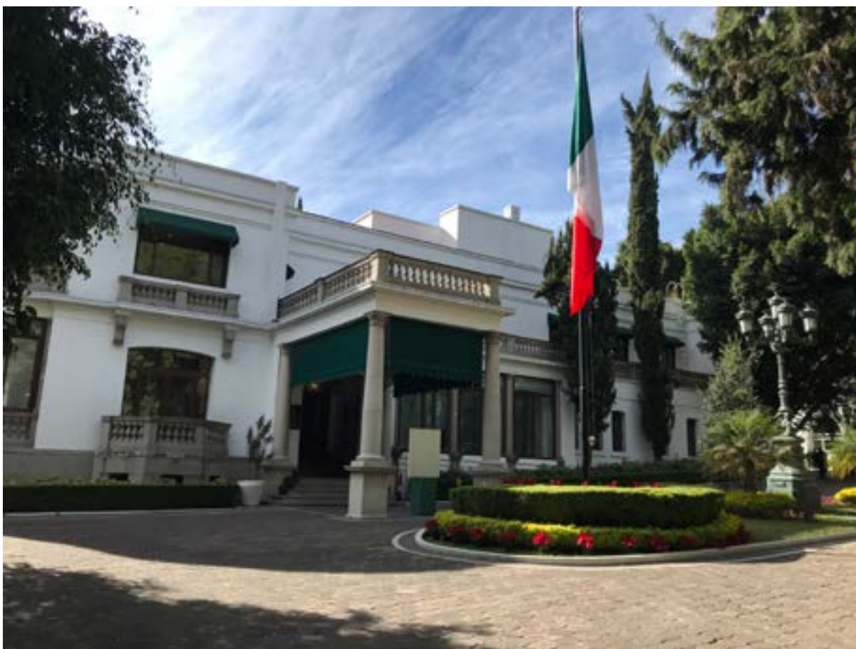
COMPLEJO CULTURAL LOS PINOS , ex Residencia Oficial de Los Pinos .