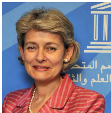
par Irina Bokova , Directrice générale de l'UNESCO

L'UNESCO est l'agence des Nations Unies chargée de promouvoir l'éducation physique et le sport à travers une action concertée, collaborative et participative afin de soutenir l'épanouissement de chaque individu.