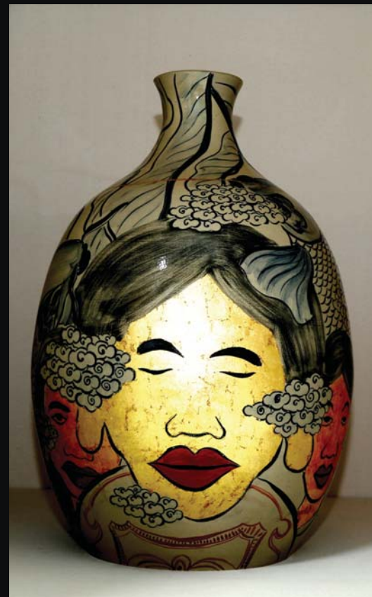
Dream 1 2017 72 x 50 (cm) Ceramic, lacquer

2015: Personal exhibition (painting): CHAM VAO TINH LANG (Touching the silence) Blue gallery, Hanoi, Vietnam