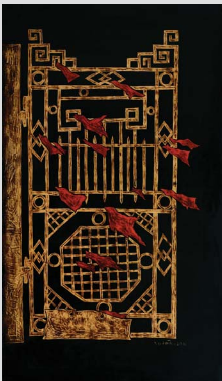
Wind 2017 120 x 70 (cm) Lacquer on wood