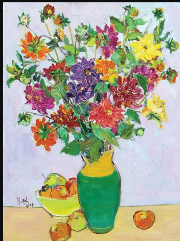
Dahlia 2017 80 x 60 (cm) Oil on canvas