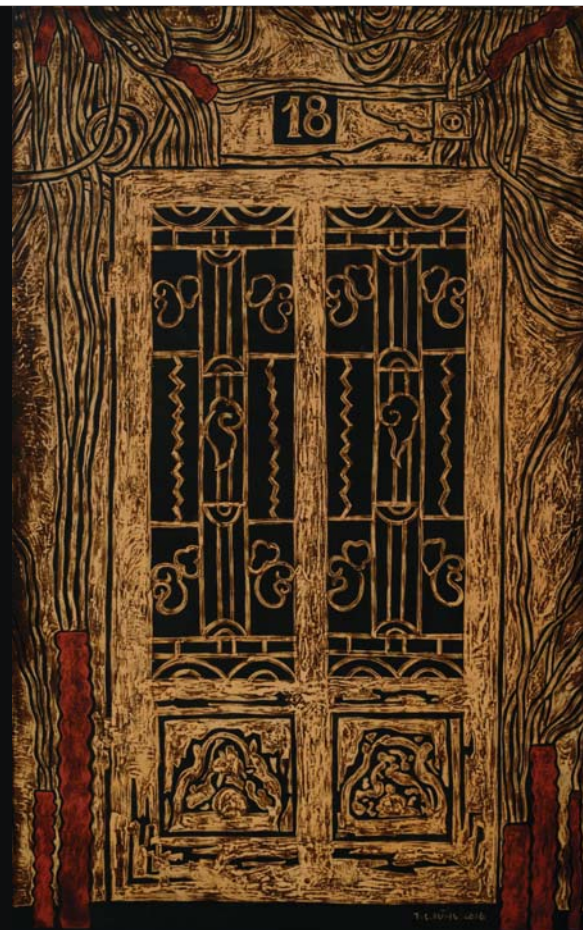
Blockade 2016 120 x 70 (cm) Lacquer on wood