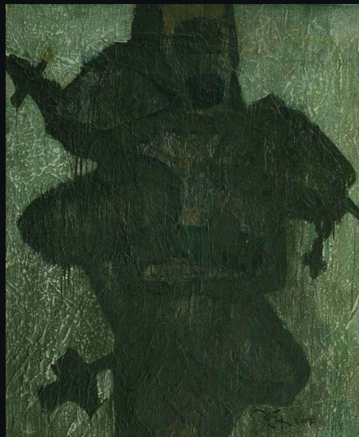
Composition 1 2017 120 x 99 (cm) Acrylic on canvas