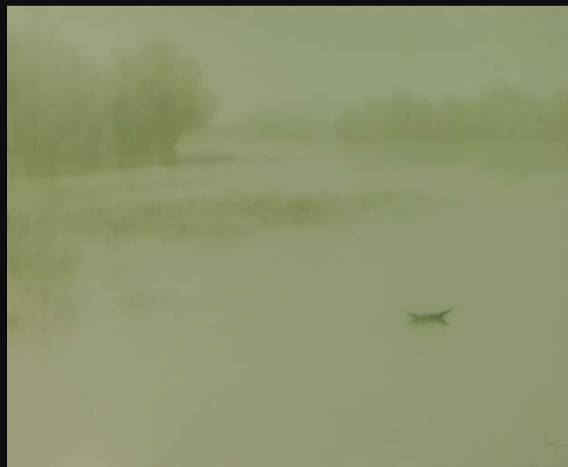
River 2017 110 x 135 (cm) Oil on canvas