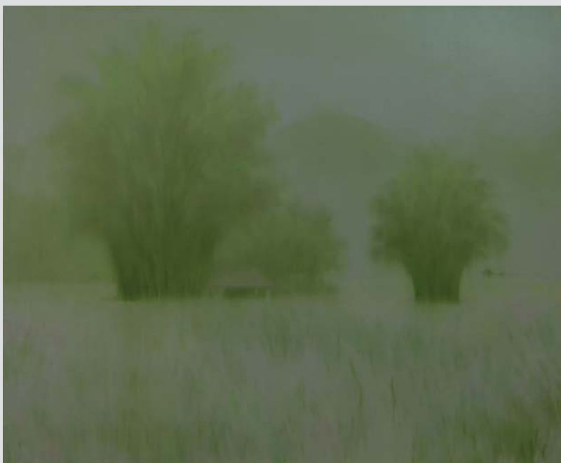
Field 2017 110 x 135 (cm) Oil on canvas