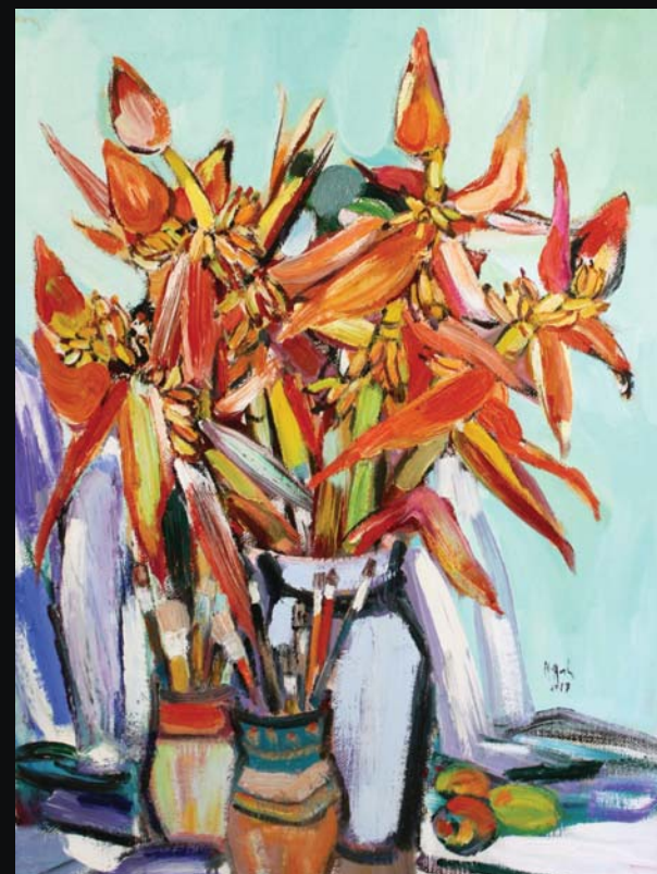
Banana flower 2017 100 x 75 (cm) Oil on canvas