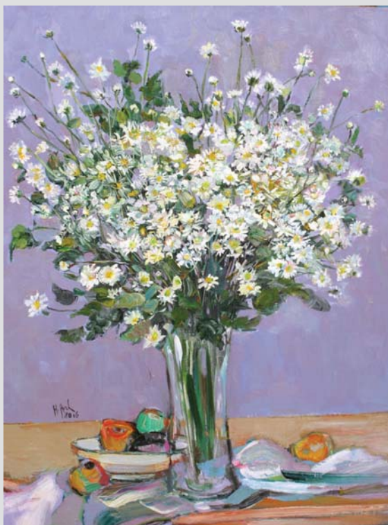
Daisy 2017 80 x 60 (cm) Oil on canvas