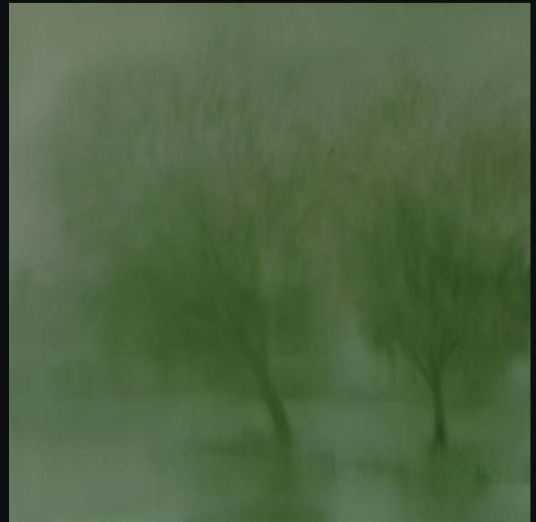
Tree 2017 80 x 80 (cm) Oil on canvas