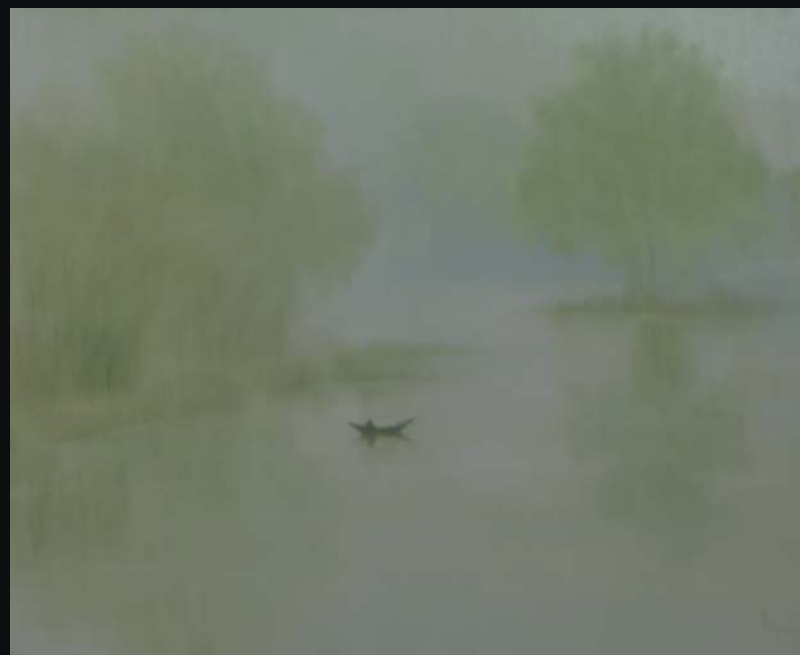
River 2017 110 x 135 (cm) Oil on canvas