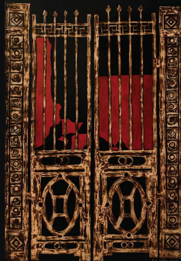
Border line 2017 120 x 70 (cm) Lacquer on wood