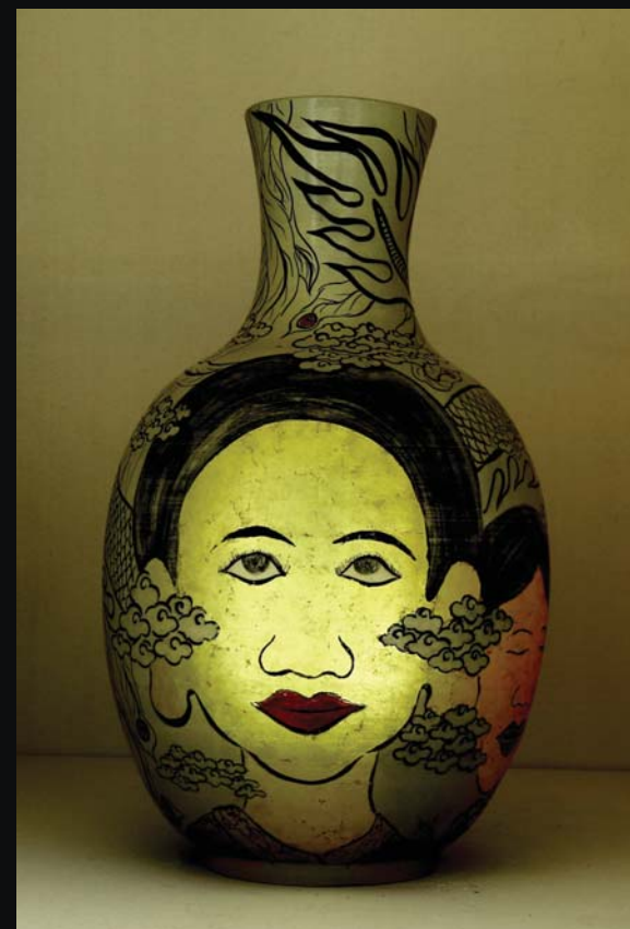
Dream 2 2017 65 x 37 (cm) Ceramic, lacquer