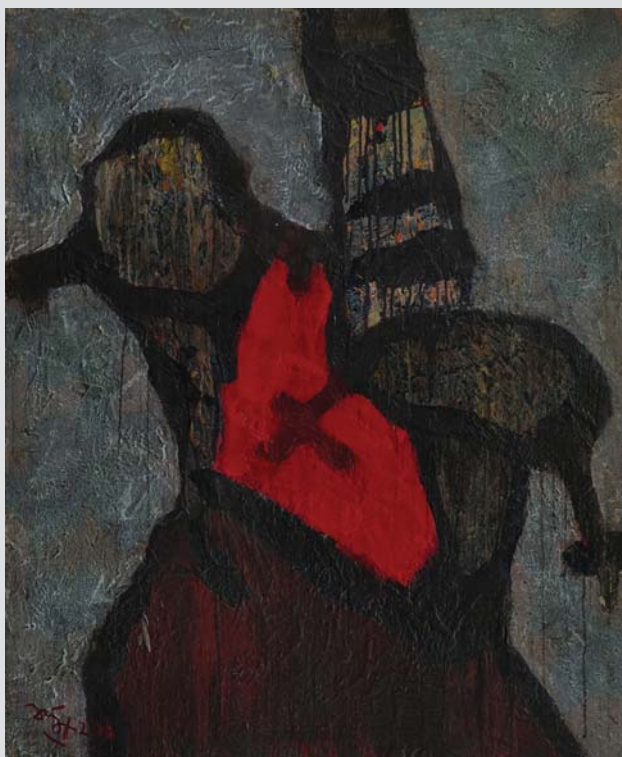
Two childrens 2017 120 x 99 (cm) Acrylic on canvas