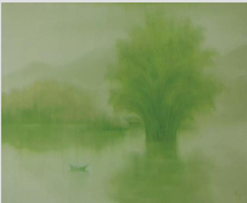
Morning 2017 110 x 135 (cm) Oil on canvas