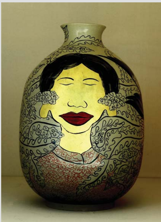
Dream 3 2017 56 x 37 (cm) Ceramic, lacquer