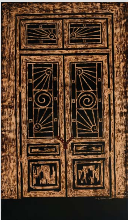
Twisting 2017 120 x 70 (cm) Lacquer on wood