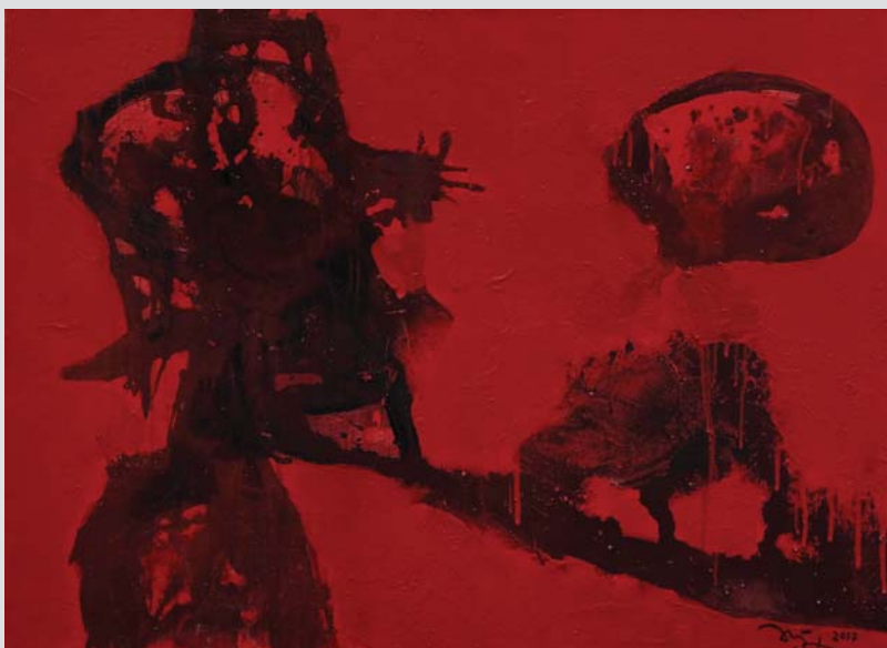
Red sun 2017 89 x 120 (cm) Acrylic on canvas