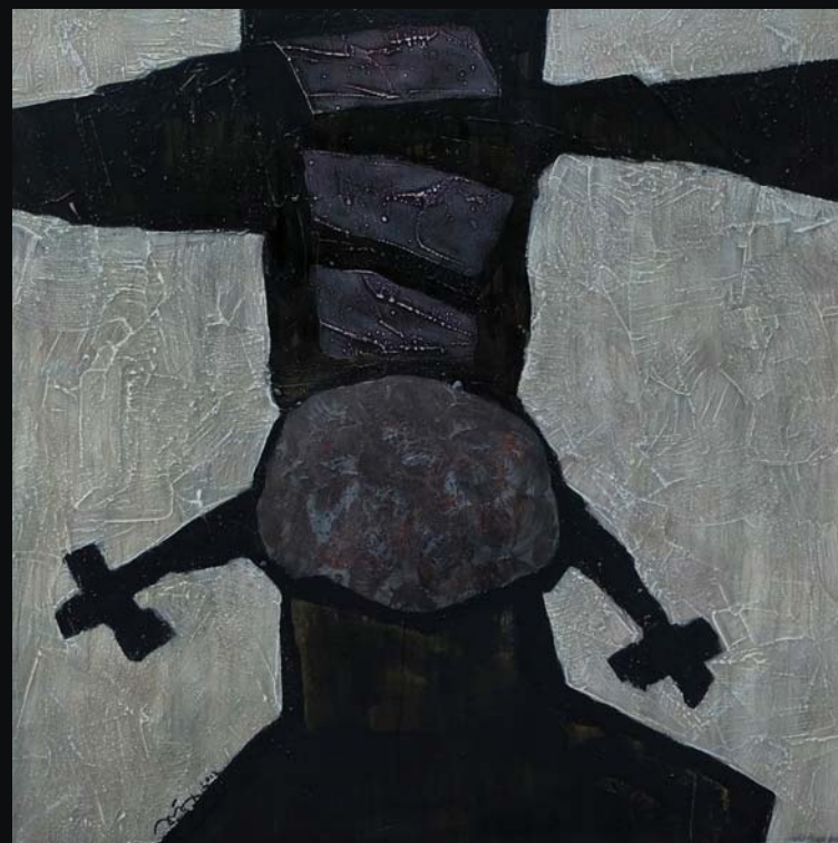
Composition 2 2017 160 x 160 (cm) Acrylic on canvas