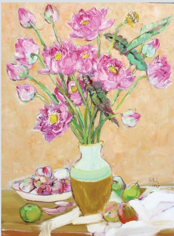
Lotus 2017 80 x 60 (cm) Oil on canvas