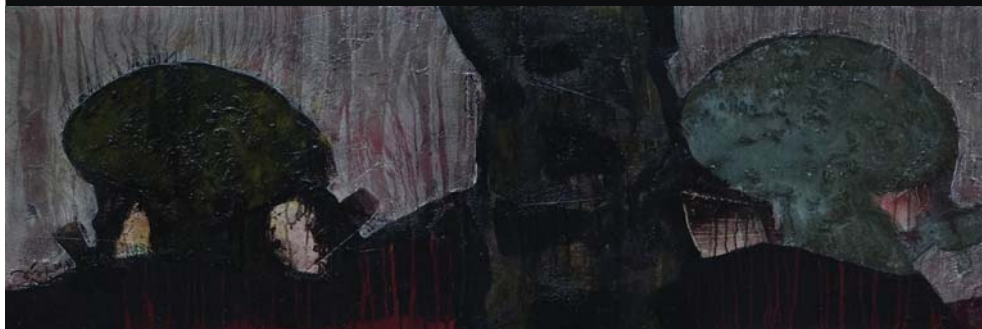
Shape and shadow